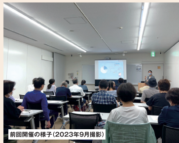
前回開催の様子(2023年9月撮影)

相続の計画を事前に作っておくことは、とても大切です。仲の良いご家族であっても、ちょっとしたきっかけで、相続が“争族”になってしまうことも……。ご家族皆様が笑顔になれる相続をお手伝いできれば幸いです。